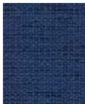
Brook r CPC04