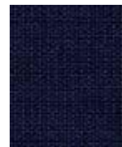
Navy Blue CPC30